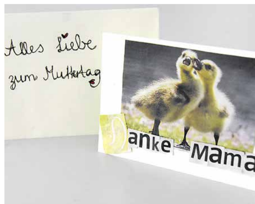
Auch das Couvert kann beschriftet und verzieren werden.