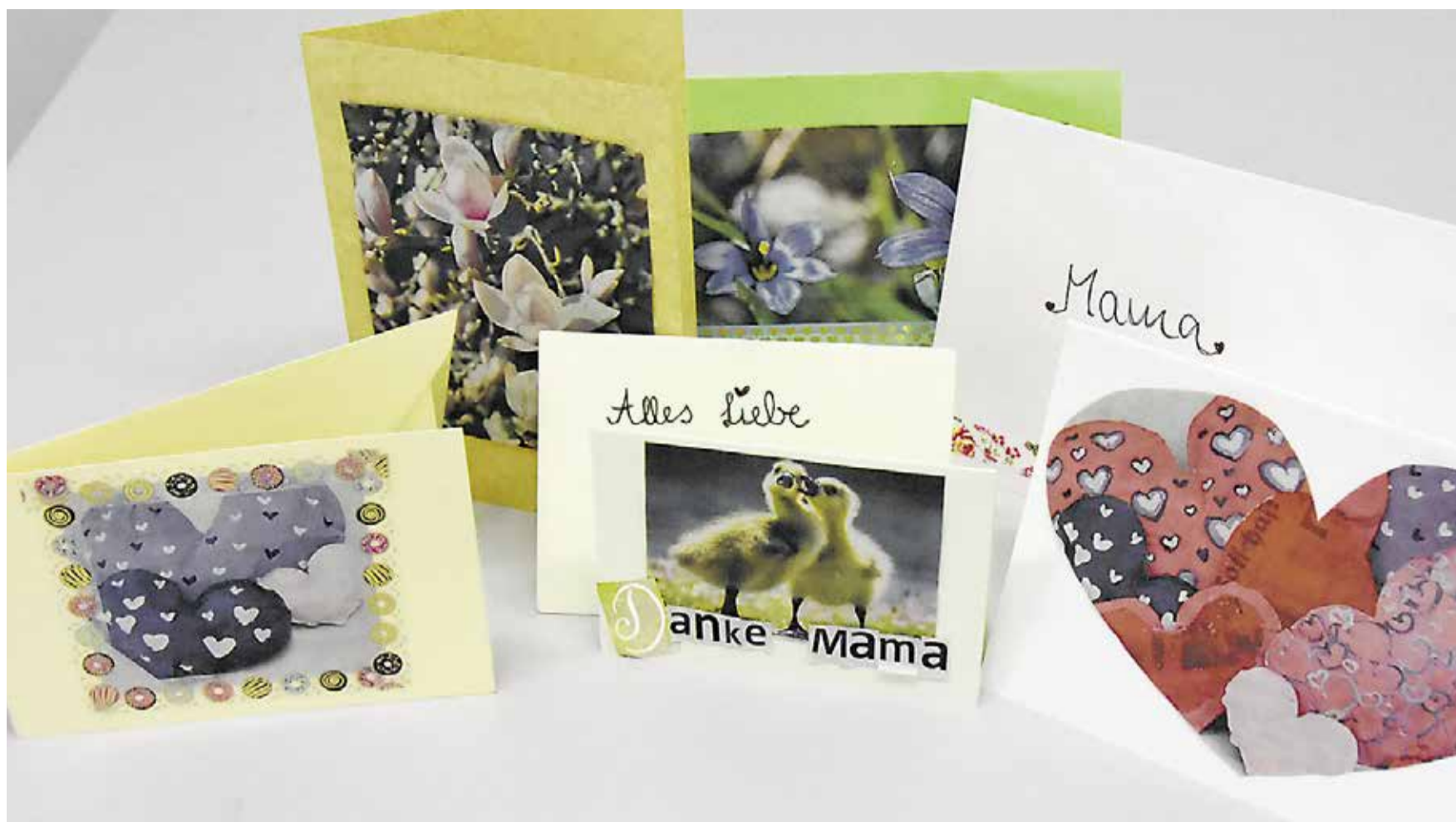
Die individuellen Muttertagskarten zaubern mit Sicherheit ein Lächeln ins Gesicht vieler Mütter – echte Dankbarkeit ist schliesslich etwas vom Schönsten, was man erhalten kann.